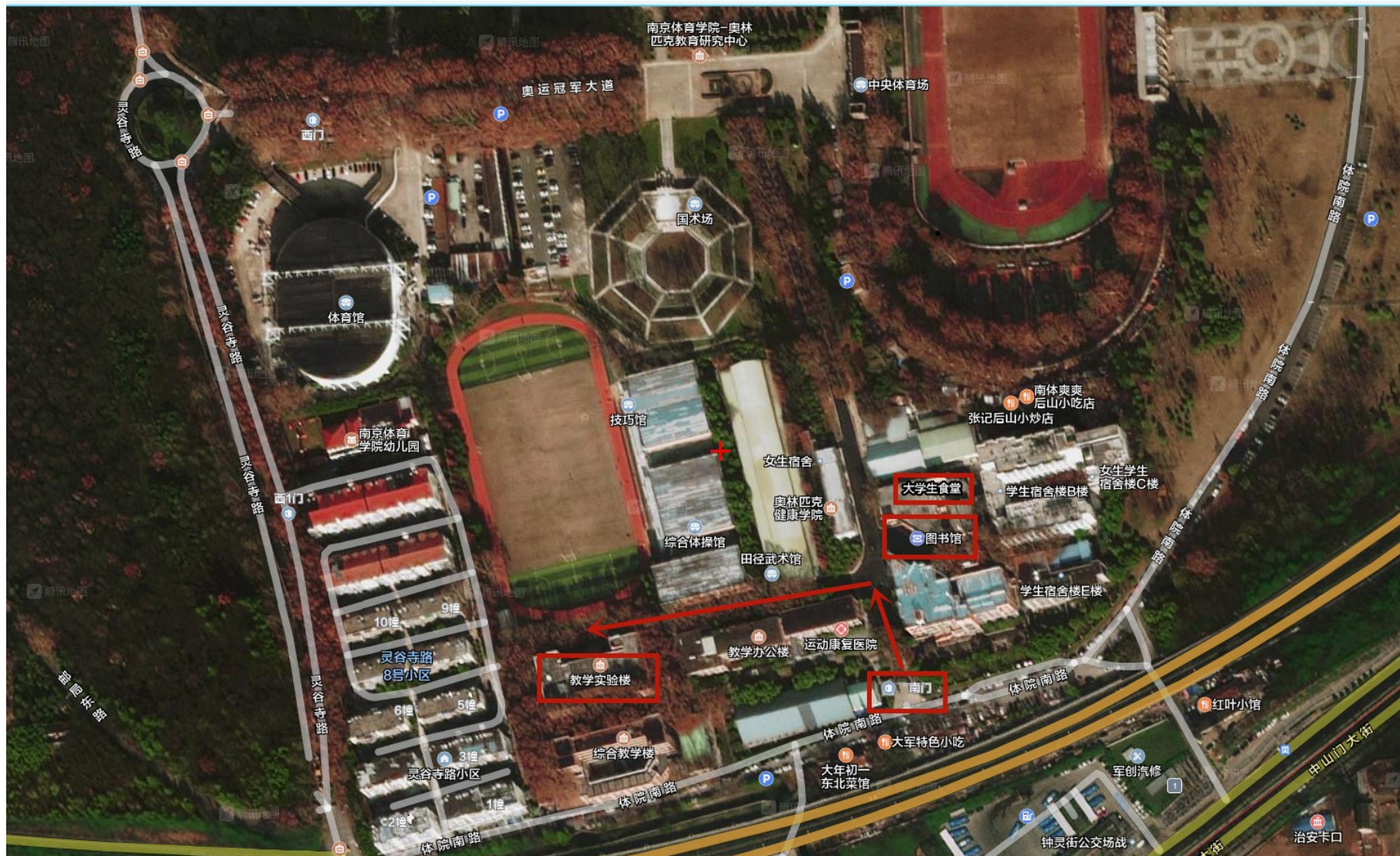
南京体育学院灵谷寺路校区示意图